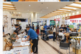
不器用 FACTORY2024 の様子